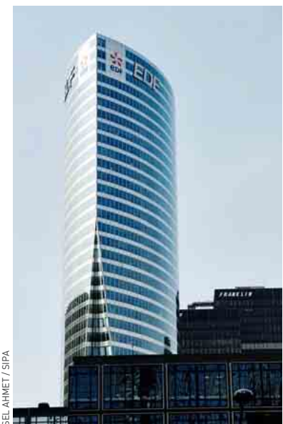
Le CE d'EDF avait été mis à l'index par la Cour des comptes en 2005 et 2007.