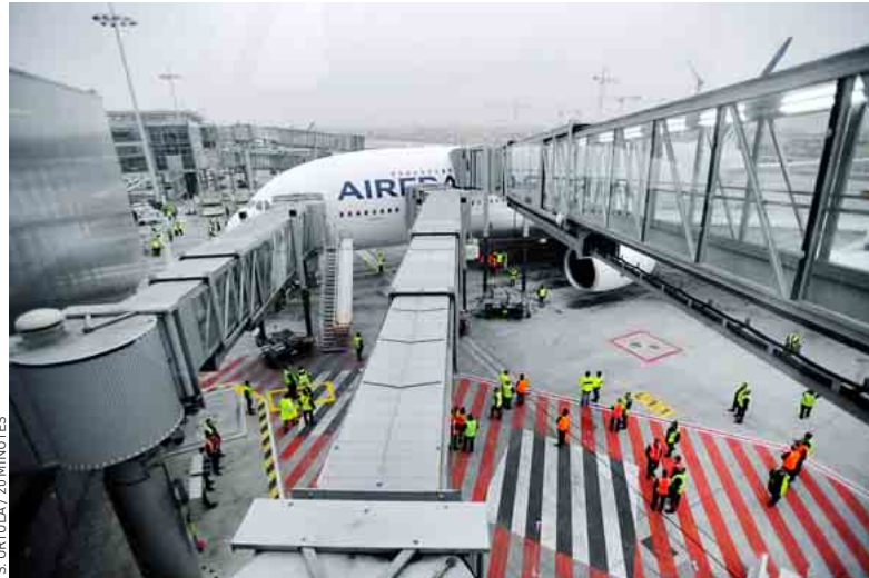
Plus de 20 millions d'euros manqueraient dans les comptes du CCE de l'avionneur.

Ce trou « inexplicable » relèverait, pour 95 %, d'une mauvaise gestion et pour 5 %, d'un possible enrichissement personnel, d'après Le Figaro . Le quotidien évoque des dépenses non justifiées avec